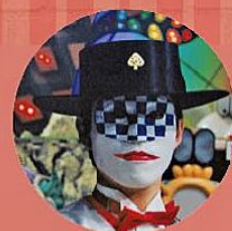
特別ゲスト トランプマン

ご当地ソースカツ丼、ひもかわうどんなど 地元の絶品グルメ&お酒をお楽しみください!! カップル成立の方には豪華景品のチャンスも!